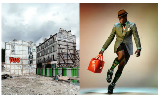
#Philippe Gueguen Photographe PARISARTISTES #

Point de départ ou point d'orgue de l'expérience PARISARTISTES#, l'exposition collective offrira aux visiteurs un instantané du meilleur de la production artistique parisienne autour de 115 œuvres. Une sélection hétéroclite qui reflète la qualité et l'exigence des artistes mais aussi l'émotion qui les transportent lors de l'acte créatif. Tour à tour poétiques ou réalistes, sombres ou lumineuses, contemplatives ou fulgurantes, les œuvres de PARISARTISTES# nous plongent dans un voyage initiatique où la pensée vagabonde d'époques en couleurs, de formes